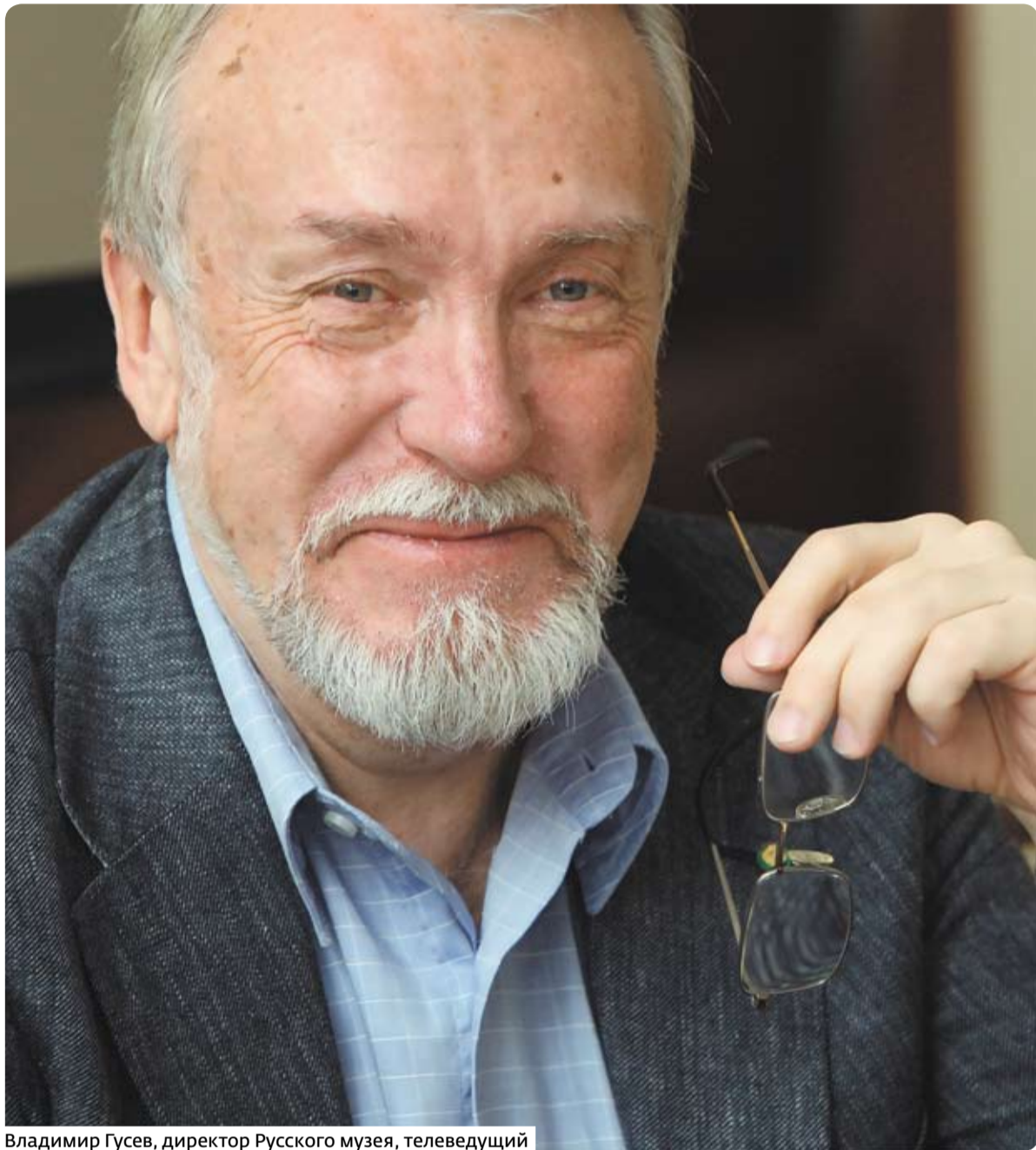
Владимир Гусев, директор Русского музея, телеведущий

Я — ЖАВОРОНОК , но уже немолодой, поэтому просыпаюсь и встаю в 8–9 часов. Утро встречаю по-разному: в зависимости от того, как провел вечер, как прошла ночь и какие дела ждут впереди.